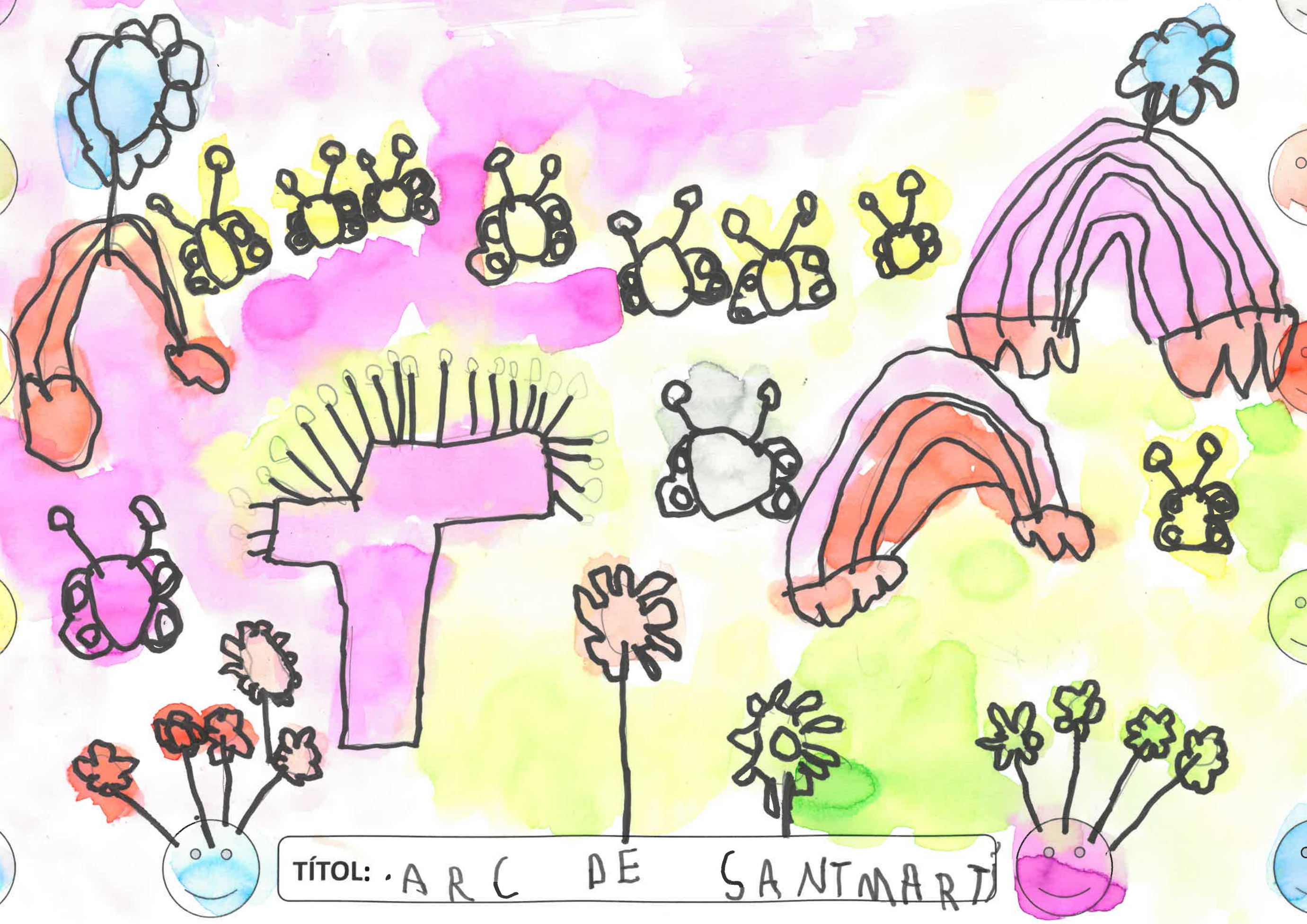
TÍTOL: ARC DE SANTMART