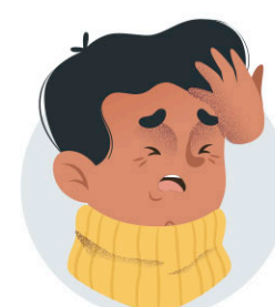
Mal de cap i cansament