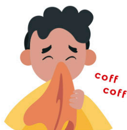
Tossir i esternudar cobrint la boca amb un mocador d'un sol ús