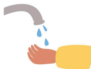
Rentar-me les mans amb freqüència