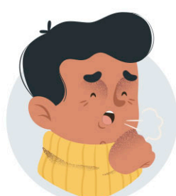
Tos seca i dificultats per a respirar