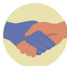
Pel contacte amb persones malaltes. Per exemple, al tocar-se o fer-se petons