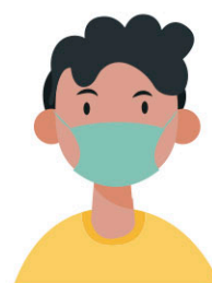
Evitar el contacte amb persones malaltes. Utilitzar mascareta si estic malalt/a.