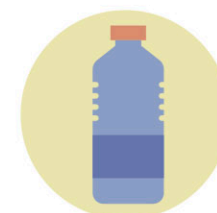
Per tocar objectes contaminats pel coronavirus