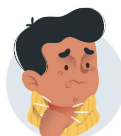
Mal de coll i de pit